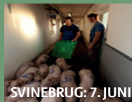
SVINEBRUG: 7. JUNI

Arbejdstilsynets temaside om ulykker i landbruget