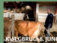
KVÆGBRUG: 8. JUNI